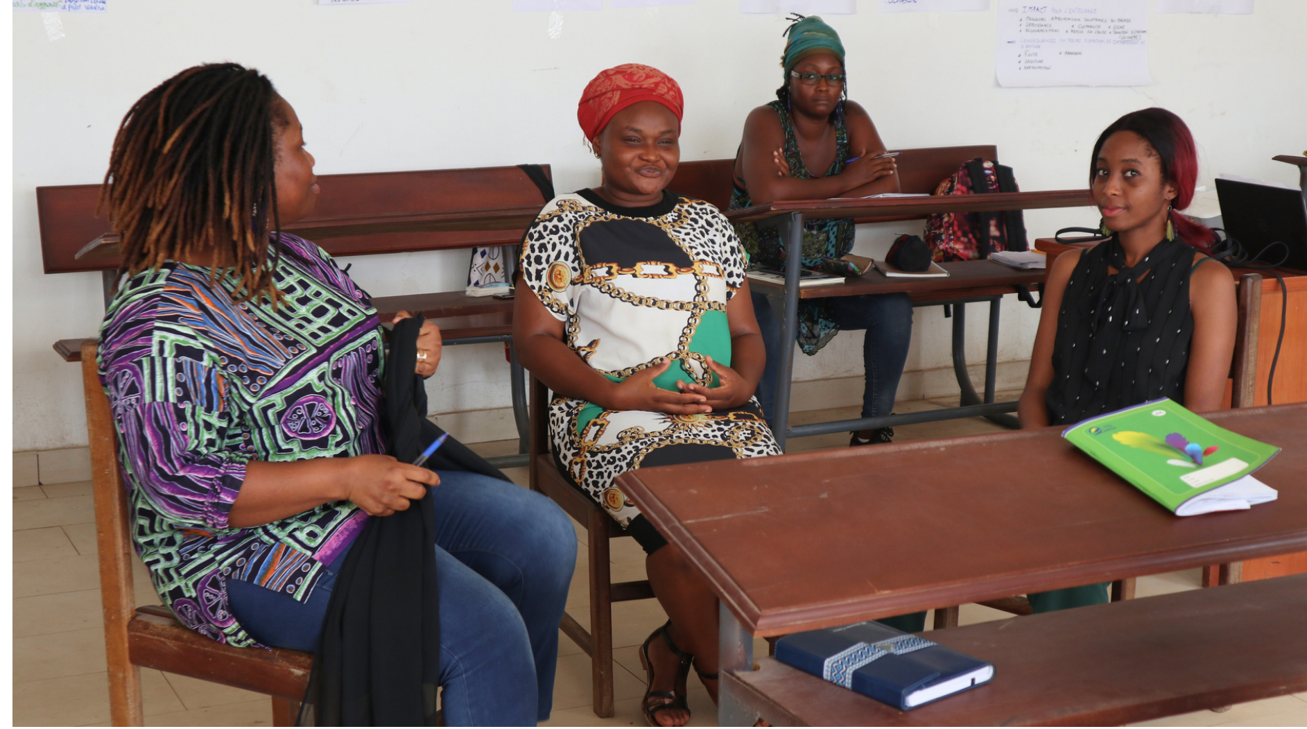
Mise en situation par groupe