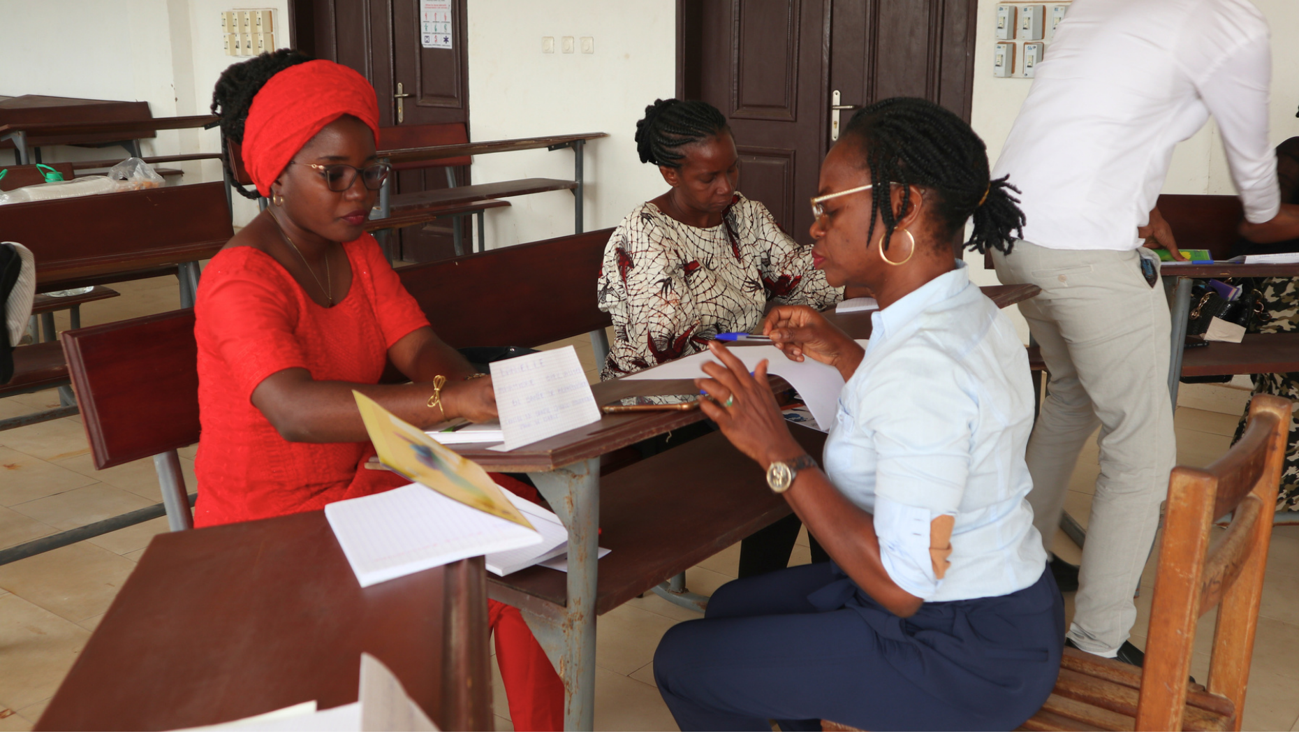
Travail en sous-groupe